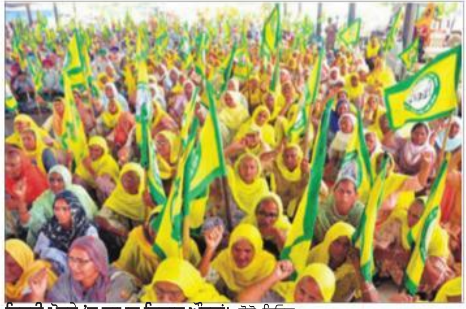
ਟਿਕਰੀ ਮੋਰਚੇ 'ਚ ਸ਼ਾਮਲ ਕਿਸਾਨ ਔਰਤਾਂ